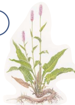
rdesno hadí kořen